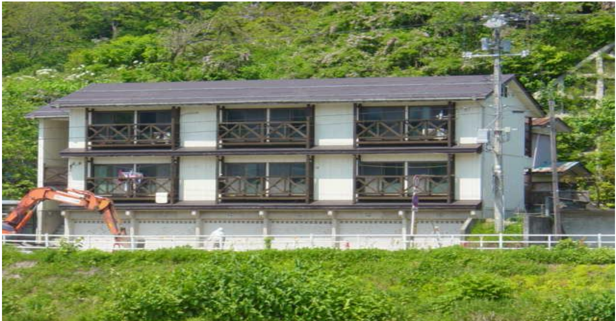
写真：旭第2住宅（名立区）