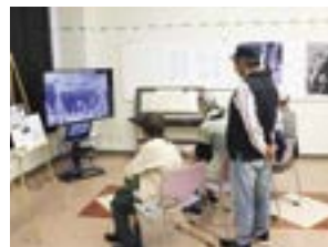
昨年の「ちめいどうまつり」

当院には「人間味ある温かい医療と療養施設を備えた、安心で快適な施設を目指す」という目標があります。看護師は常に患者さんに寄り添い、小さな変化に気づくことができる存在だと考えており、書籍などで紹介されている大関和の「慈愛と奉仕」の精神ともつながります。その「優しさや強さ」を今後も大切に、これから看護師として働く後輩に伝えていきたいです。