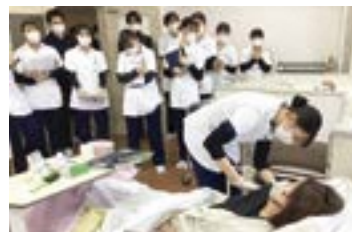
授業でのロールプレイの様子

高校時代、野球部で大きなけがをした時に、担当の看護師の存在が一番の心の支えになりました。その人のように、患者さんの気持ちに寄り添い、支えになれる看護師になりたいです。