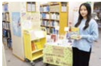
図書館内の大関和特別展示ブース

私は、より専門性の高い医療知識を持つ「特定行為看護師」を目指しています。多くの著書を残し、看護を探究し続けた大関和のように、学び続ける姿勢を大切にしていきたいです。