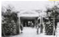
当時の知命堂病院