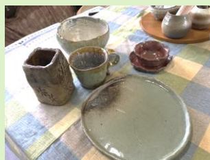
マイ“器”を作ります