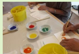
岩絵の具で塗り絵に挑戦