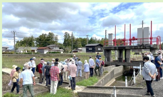
R5頸北カレッジ「保倉川の歴史」現地学習の様子

連絡先:頸城地区公民館 (頸城区総合事務所内 三宅) ☎025-530-2311