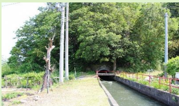
世界かんがい施設遺産「上江用水路」