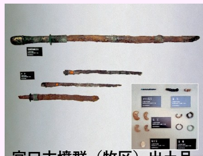
宮口古墳群 (牧区) 出土品

時間： 9:00～12:00 集合場所： 釜蓋遺跡ガイダンス (大和5-4-7) 費用： 200円 (牧歴史民俗資料館入館料)