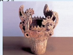
塔ヶ崎遺跡出土品

時間: 10:00~10:30 (展示案内) 10:30~11:00 (語り合い) 場所: ユートピアくびき希望館 (頸城区百間町716)