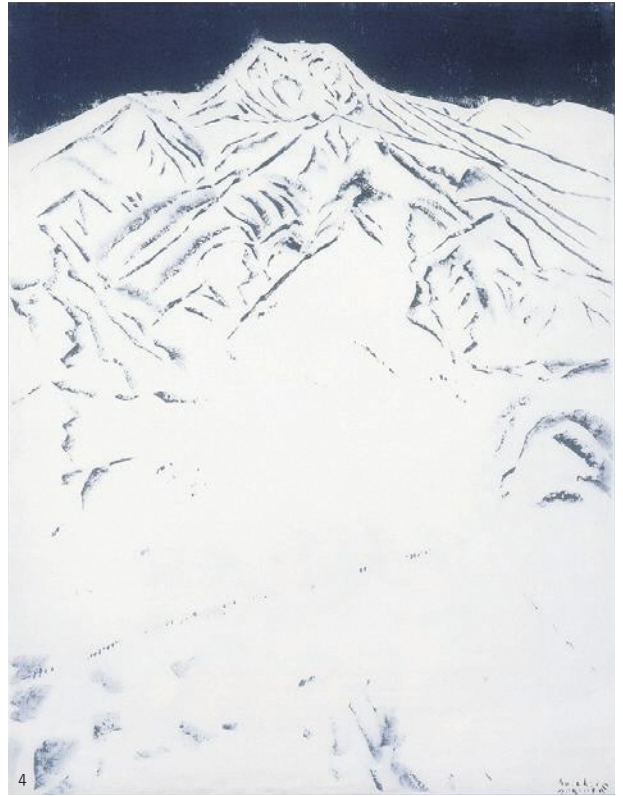
1. 増谷直樹《雪の日》 2. グループGUN《雪のイメージを変えるイベント》 3. 柴田長俊《道(久比岐野十二景)》 4. 富岡惣一郎《妙高山》 5. 岩野勇三《待合室》