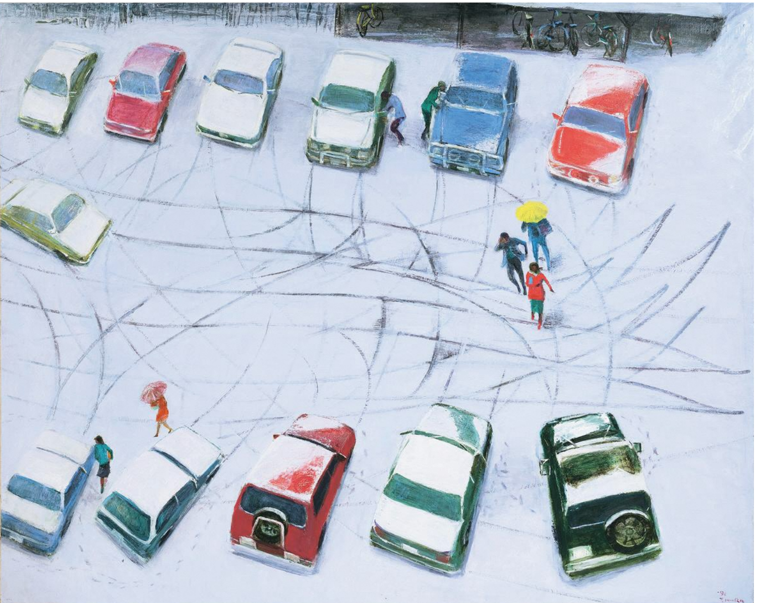
村山陽《雪の朝 駐車場俯瞰》