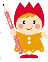
チュッピーちゃん 新潟県統計イメージキャラクター

※この用紙は提出する必要はありません。 点検結果は、様式3「統計グラフコンクール応募作品チェックシート」により提出してください。