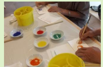
岩絵の具で塗り絵に挑戦