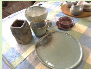
マイ“器”を作ります