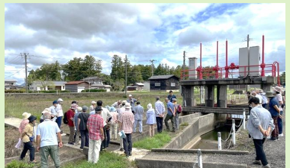
R5頸北カレッジ「保倉川の歴史」現地学習の様子

連絡先:頸城地区公民館 (頸城区総合事務所内 三宅) ☎025-530-2311