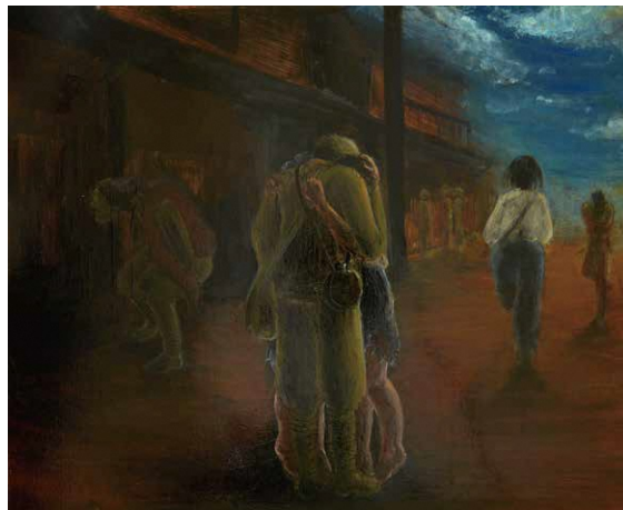
「再開」作…三戸奈津美 所蔵…広島平和記念資料館

被爆の実相を後世に残すため、広島市立基町高等学校の生徒が被爆者と共同で制作した絵を展示します。