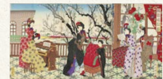
「梅園唱歌図」明治20 (1887) 年【前期展示】

明治時代は西洋文化の流入により、人々の服装や生活、娯楽が激変しました。鹿鳴館時代に象徴される上流階級の華やかな洋装ドレスは、多くの女性の憧れとなります。周延の「開化絵」から文明開化の様相を紹介します。