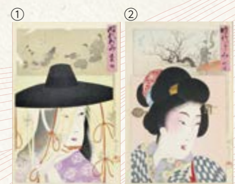
①「時代かがみ 建武之頃 竹馬の古図」明治30 (1897) 年【前期展示】 ②「時代かがみ 明治 臥龍梅」明治30 (1897) 年【後期展示】

周延は“美人画の浮世絵師”として知られており、多彩なテーマを描いた作品の中心には女性の姿がみられます。『時代かがみ』は周延の集大成と言われ、建武期～明治期の500年間にわたる各時代の女性風俗を描いた美人画大首絵のシリーズです。今回は全53枚のうち、題名違いの1枚を除いた52枚を前期・後期展示で半分ずつ紹介します。