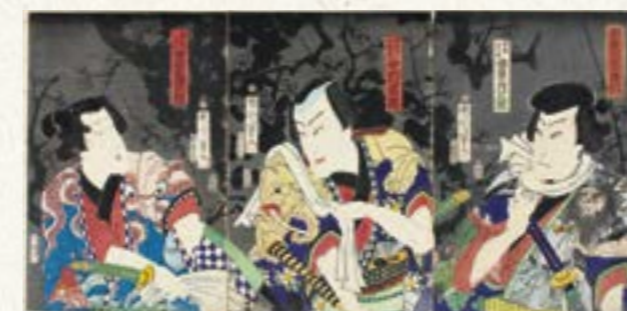
豊原国周、楊洲周延作「春霞大江戸達引 鍾馗半兵衛 坂東彦三郎、御所の五郎蔵 中村芝翫、八重桜才三 坂東三津五郎」慶応2 (1866) 年【前期展示】

周延が三代歌川豊国門下の頃に名乗っていた「二代芳鶴」時代に描いたものや師・豊原国周と一緒に合筆し、国周の役者絵で背景を描いた作品など、浮世絵師として活動し始めた初期に描いた貴重な作品を紹介します。