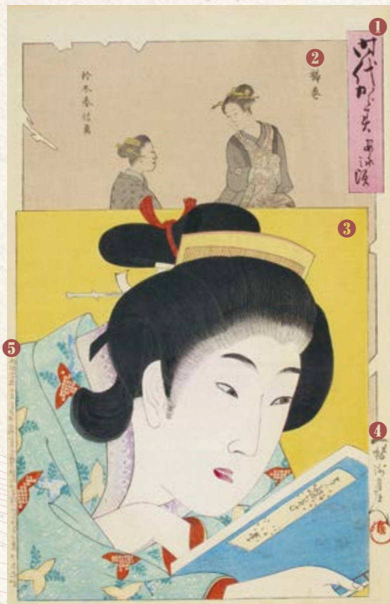
「時代かがみ 安永之頃 櫛巻 鈴木春信画」明治30 (1897) 年【前期展示】

浮世絵には豊富な情報が盛り込まれており、描かれた内容が分かると浮世絵をさらに楽しむことができます。『時代かがみ』を見れば、各時代に流行した名所や風俗などがわかりますので、特別展で見比べてみてください。