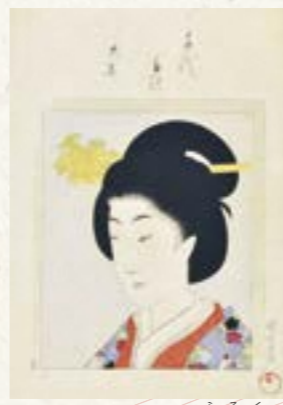
「千代田之大奥 富禄久」明治29（1896）年【前期展示】

近年、町田市をはじめ東京で大規模な展覧会が開催されるなど、注目されている浮世絵師の一人です。