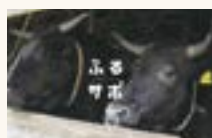
▲YouTubeで参加事業者の魅力を発信中