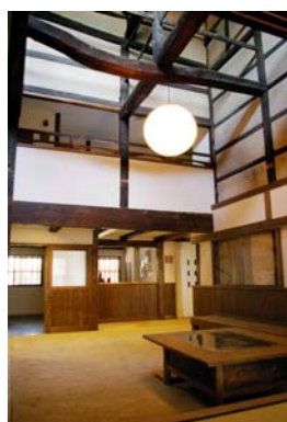
③ロビー 町家の吹抜けと天窓がみられるロビーです。休憩所として利用できます