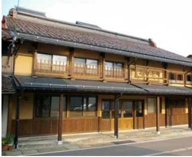
施設の外観(本町通りより)