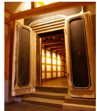
⑦ギャラリー蔵 (ギャラリー2) 明治時代の土蔵を活用したギャラリーです