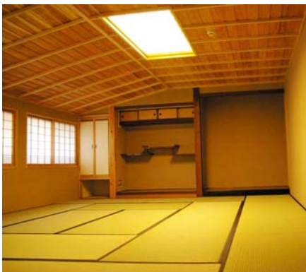
⑤表二階 (和室2) 会議などに利用できる和室です