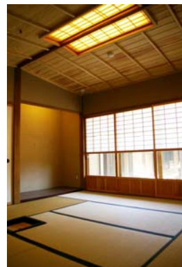
④茶室 (和室1) 簡易な茶室として利用できる和室です