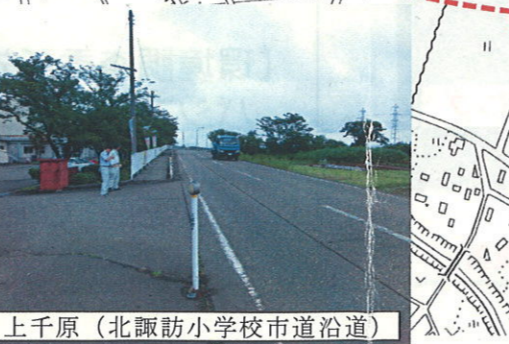
上千原 (北諏訪小学校市道沿道)