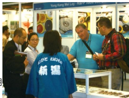
台湾ハードウェアショーNICOブースの様子