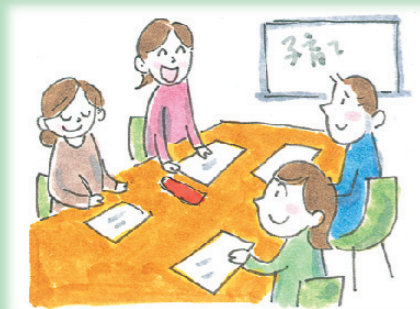
例えば、子育て支援策を考える会議に参加して意見を言う