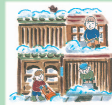
例えば、公共的課題（歩道の雪処理）は、市民と行政（流雪溝）の力で解決