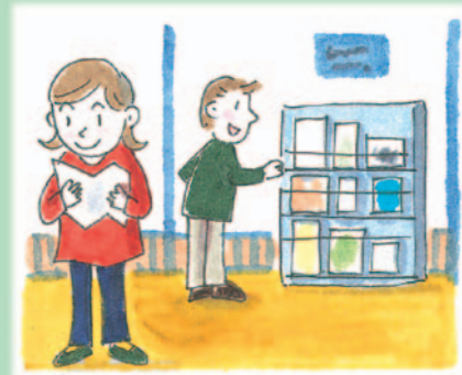
例えば、市政情報コーナーで○○計画を閲覧