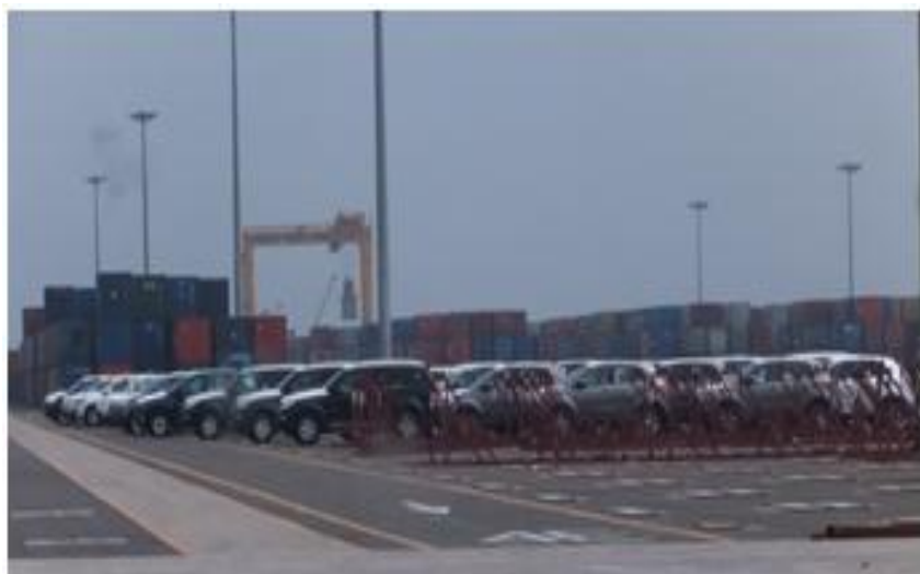
迎日湾港 ロシア向自動車