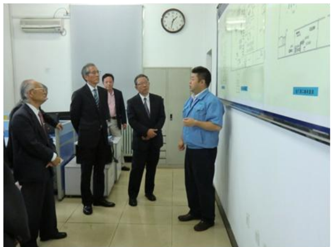
延吉秀愛食品有限公司