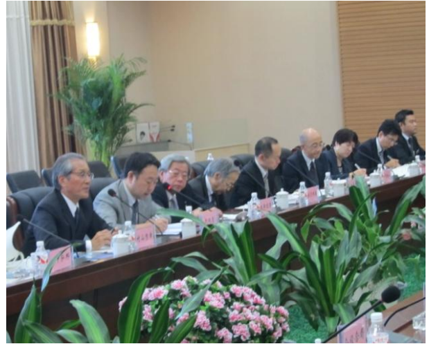
航務局、經濟技術合作局ほかとの意見交換