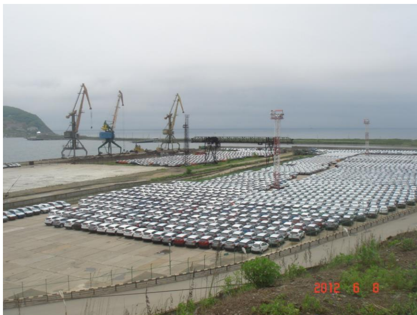
ロシアに輸入された自動車