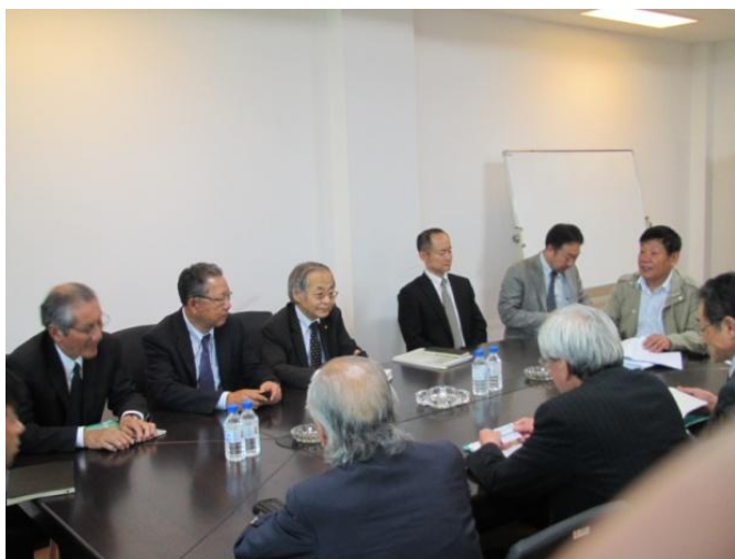
東北アジア鉄路局