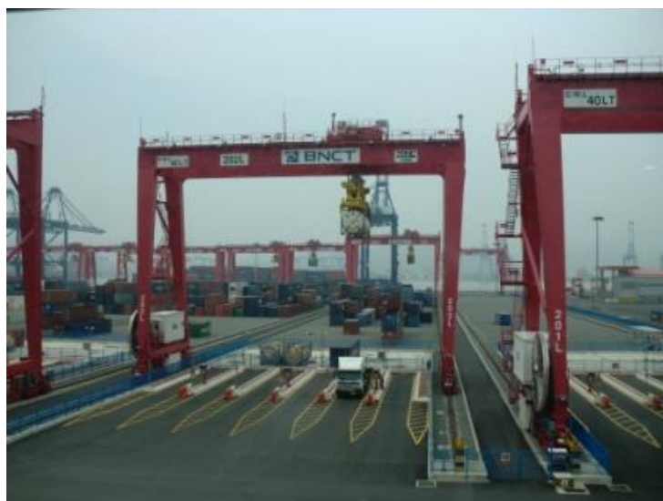
釜山新港 最新のコンテナ荷役システム