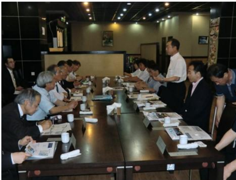
延辺日本人会との 意見交換会