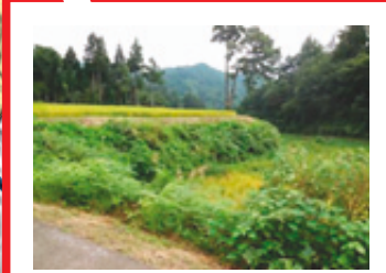
過去、大雨により畦畔 崩落発生箇所