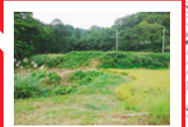
過去、大雨により畦畔 崩落発生箇所