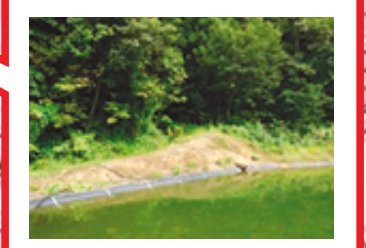
大雨時に水害発生する 恐れ有り