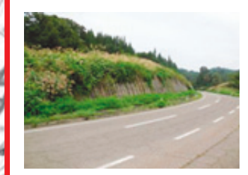
大雨時、土砂崩落の恐 れ有り