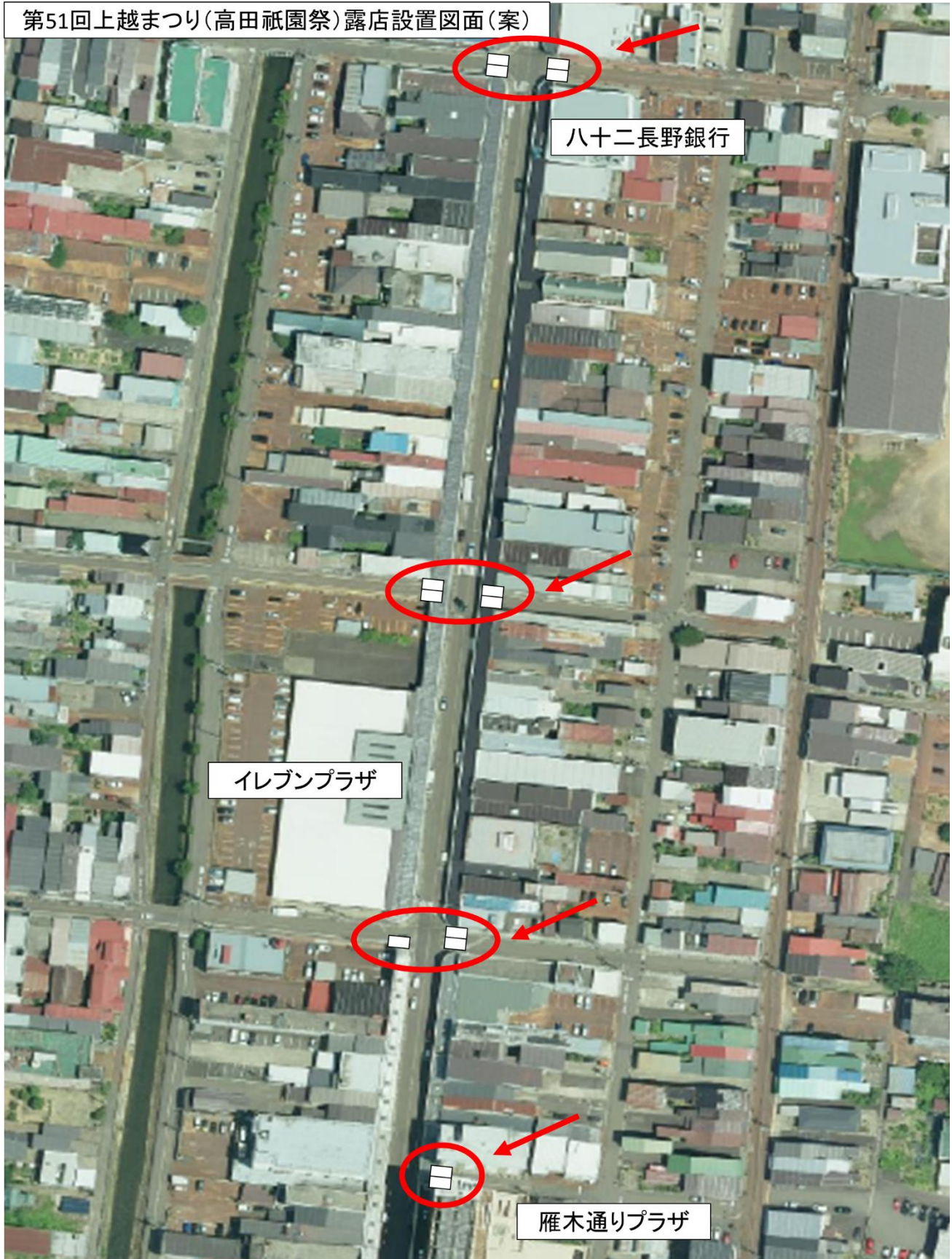
第51回上越まつり(高田祇園祭)露店設置図面(案)