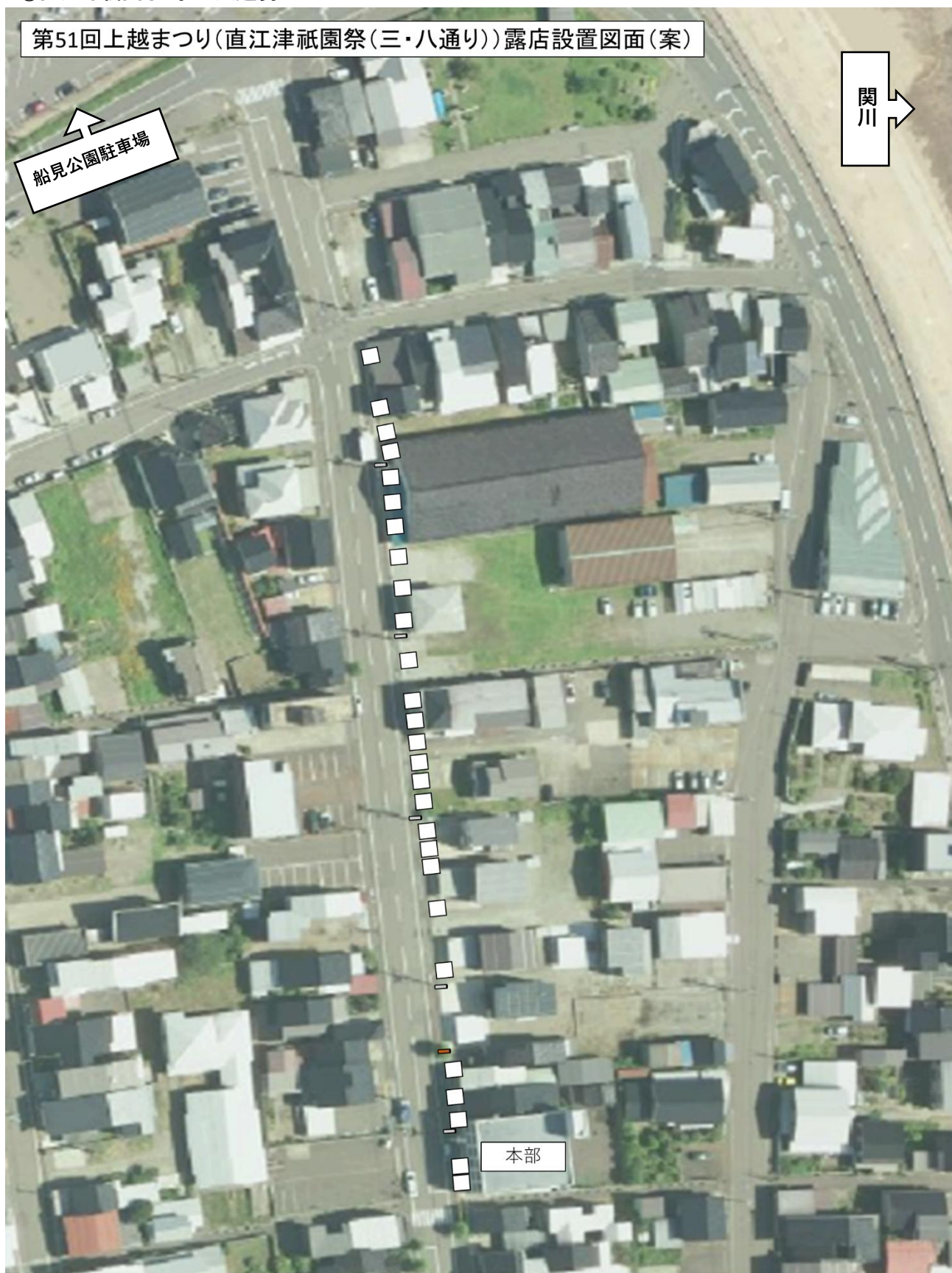
第51回上越まつり(直江津祇園祭(三・八通り))露店設置図面(案)