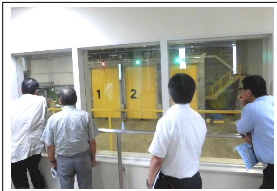
②ごみ受入れ施設(プラットホーム)