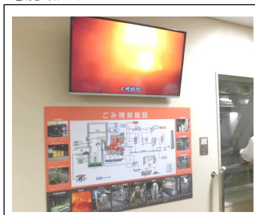
④焼却炉内モニター