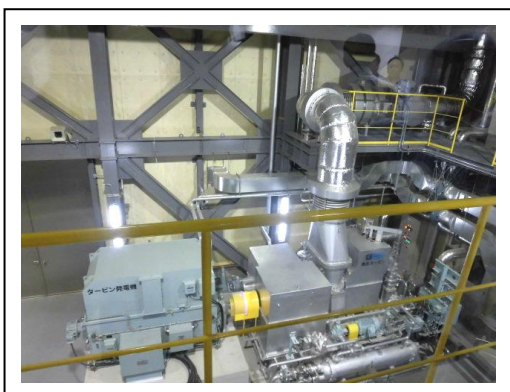
⑤蒸気タービン発電機