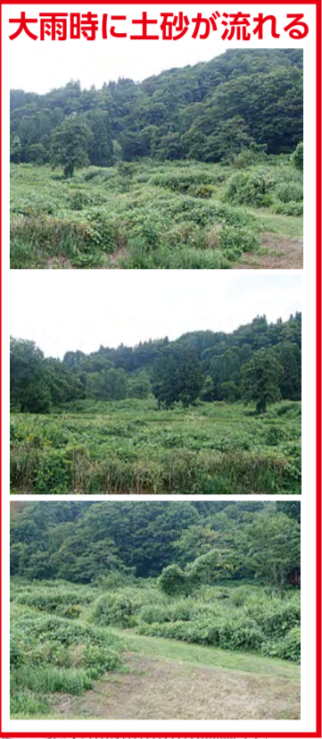
大雨時に土砂が流れる