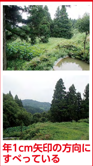
年1cm矢印の方向にすべっている