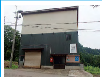
東山寺公民館 ※警戒区域内のため速やかに安全な場所へ避難が必要