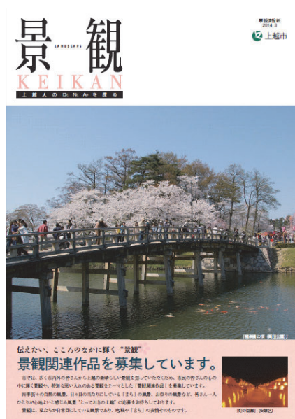
景観情報誌 (平成 26 年度発行)