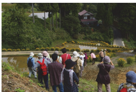
住民参加の景観セミナー (安塚・浦川原・大島地域)