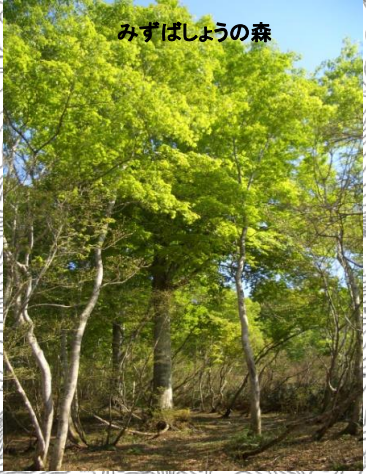
みずばしょうの森