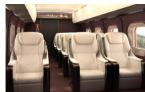
<グランクラスイメージ>