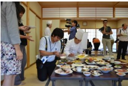
取材陣からも舌鼓が！

9月9日には「越五の国御膳」「越五の国弁当」の試作品を制作し、発表会を実施しました。