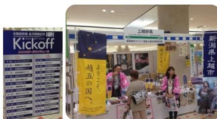
10月12～13日 (金沢駅) 北陸新幹線金沢開業キックオフイベント