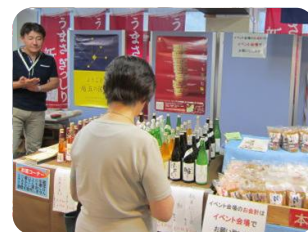
10月11～14日 妙高の秋 新潟館ネスパス(渋谷区)