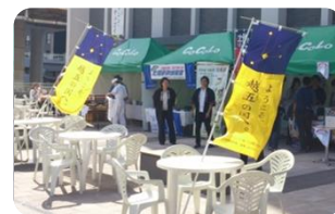
10月12～13日 鉄道の日イベント(新潟駅 南口)