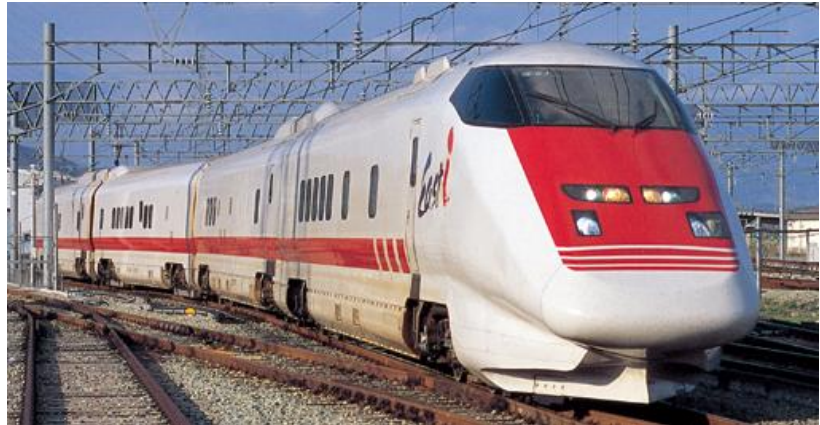
イースト・アイ(新幹線電気・軌道総合検測車) JR東日本提供

連携会議では、最初の試験走行列車をお迎えする「歓迎セレモニー」の実施について検討を進めています。実施内容が決定次第、越五の国Webサイトなどでお知らせします。