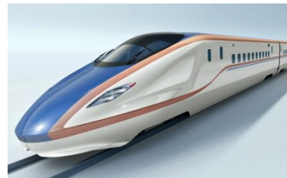
東京～金沢間の運行を予定している車両イメージ

選定理由を、「かがやき」は「輝く光がスピード感と明るく伸びていく未来をイメージさせるため」、応募数9,083件で最多の「はくたか」は「スピード感があり首都圏と北陸をつなぐ列車として親しまれているため」と説明しています。