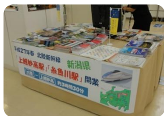
10月3～9日 大新潟物産展 西武デパート高槻店(大阪府)