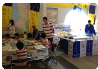
10月5～6日 直江津鉄道まつり