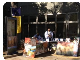
10月12～14日 港区民まつり (東京都港区)