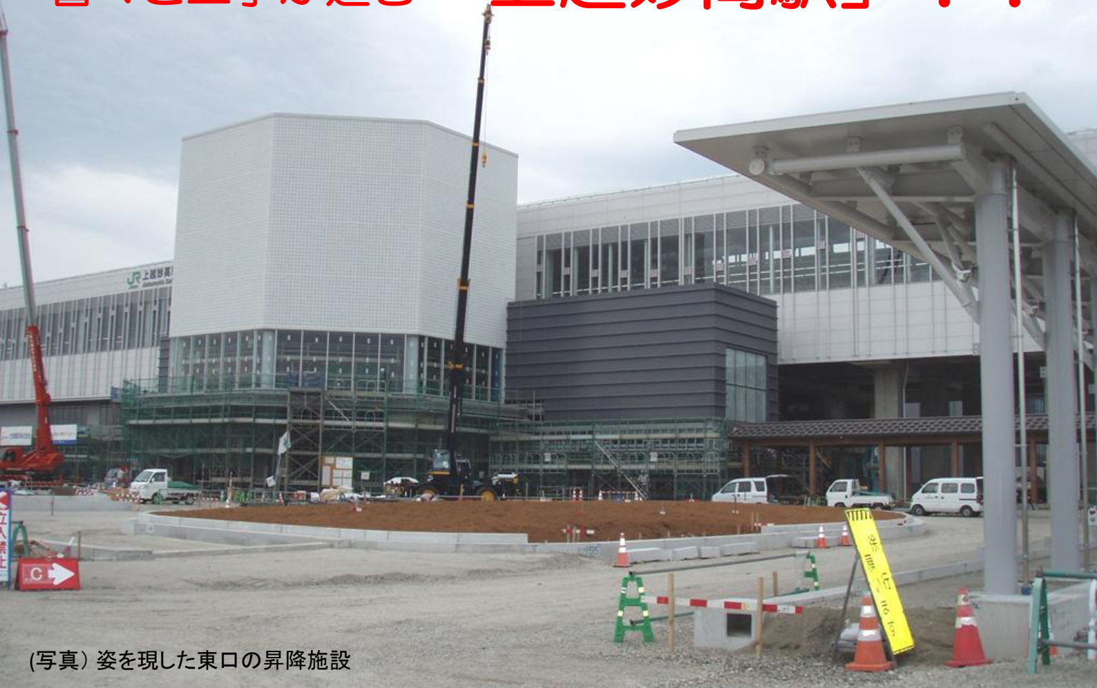
(写真) 姿を現した東口の昇降施設

新幹線駅舎のほか、東口、西口の都市施設や並行在来線の工事も順調で、平成27年春の開業に向けた準備が着々と進んでいます。