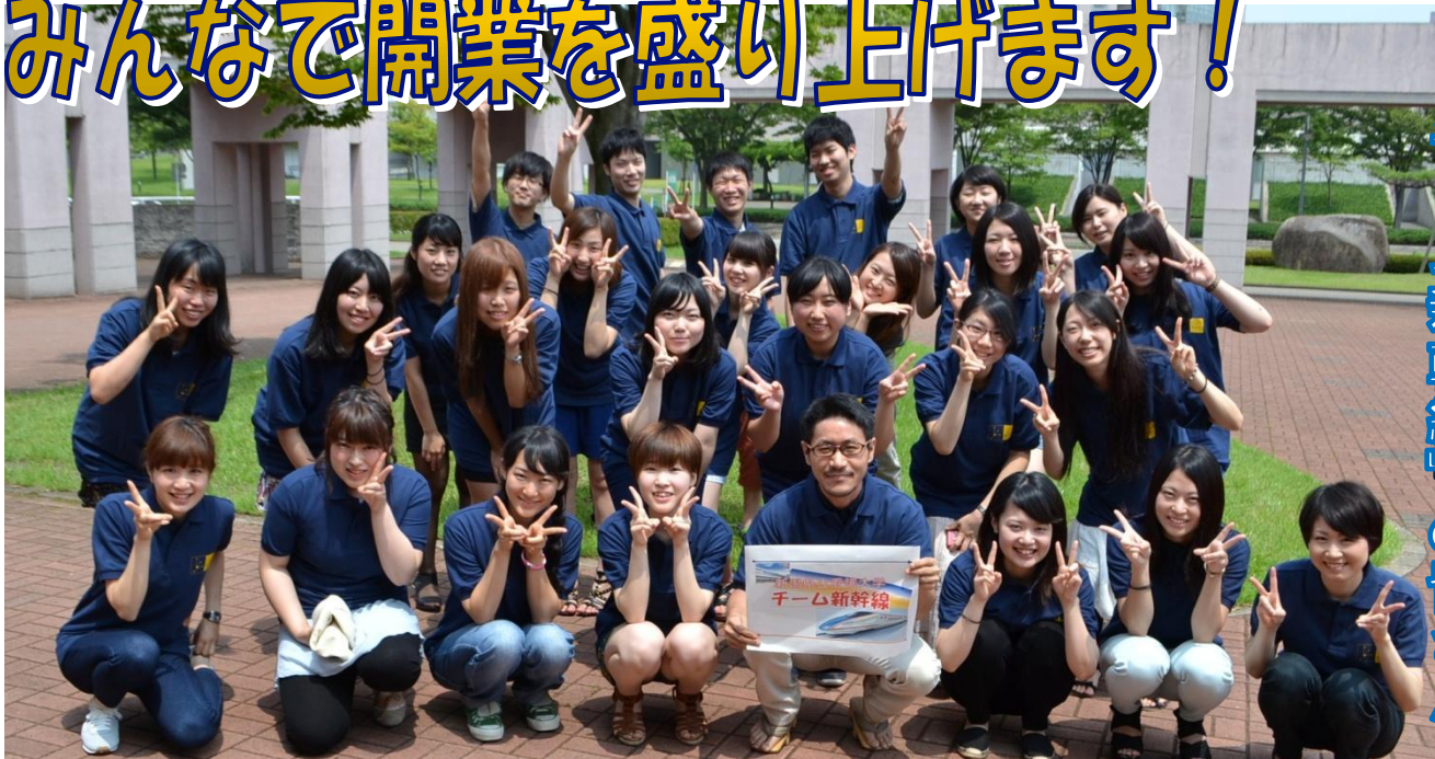
新潟県立看護大学の皆さん 「チーム新幹線」の皆さん