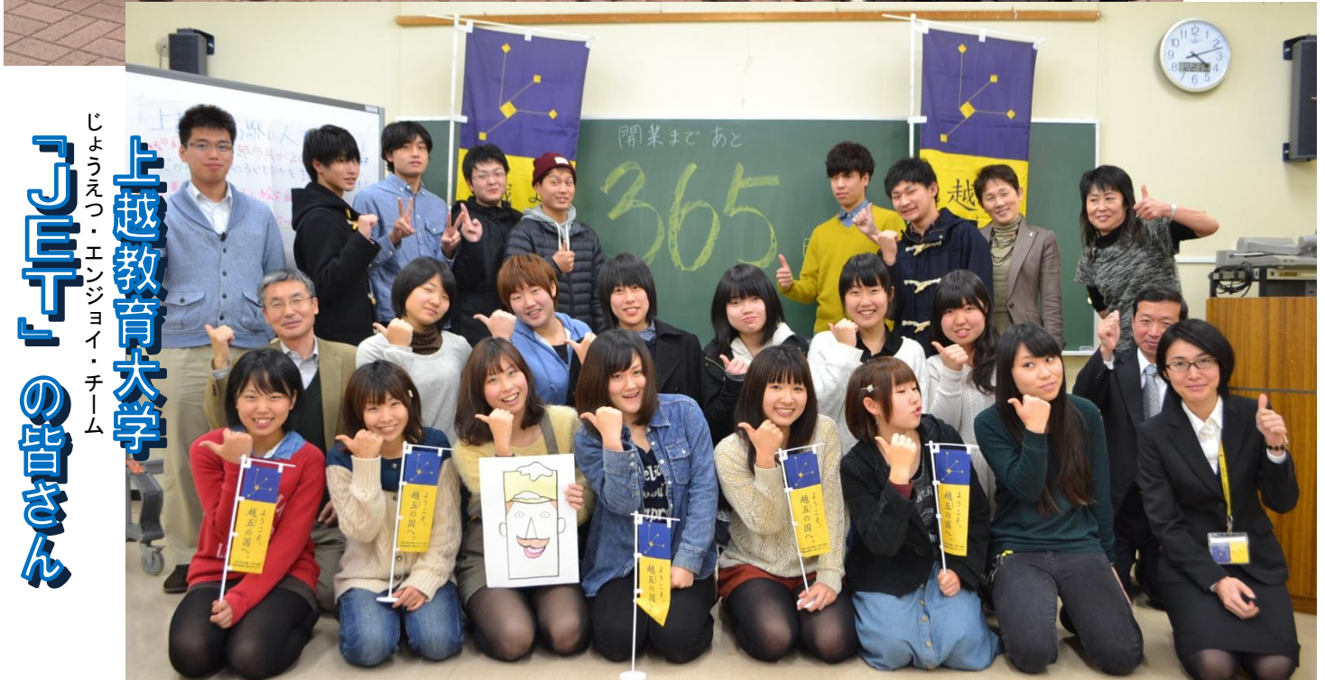
上越教育大学の皆さん 「JET」の皆さん じょうえつ・エンジヨイ・チーム

★上越教育大学の皆さんは今年で「JET」3期生。体験学習授業でキャンパスを飛び出し、地元の魅力を発見しては越五の国ホームページでPRしています。卒業後は、先生として全国各地で子供たちに発見した地域の魅力を伝える「PR大使」のタマゴの皆さんなんです。(写真は2期生たち) ★一方の県立看護大学の皆さんは、開業を盛り上げようとグループを立ち上げたばかり。これからのイベントで大活躍の予感です!