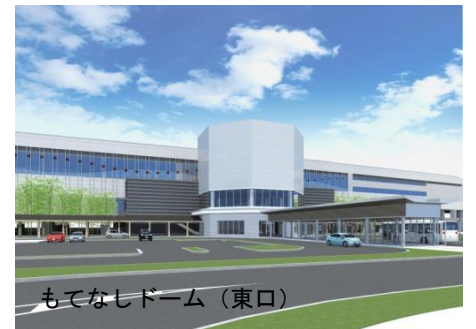
もてなしドーム (東口)