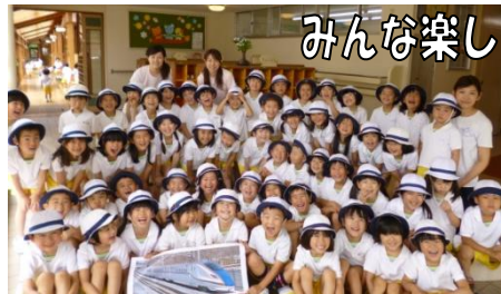
「新幹線に乗りたいなー！」(上越市いすみ幼稚園年長組の皆さん)