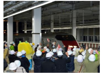
▲試験走行列車「イーストアイ」 歓迎セレモニー（昨年12月）

※歓迎セレモニー参加者募集は終了しました。 ※定員を超えるお申込みをいただきありがとうございました。