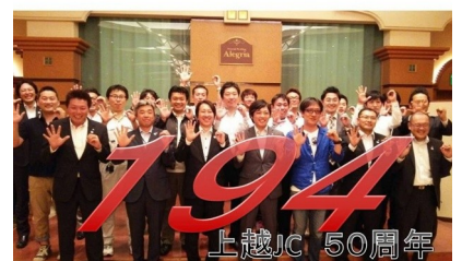
【9月1日のカウントダウン写真】