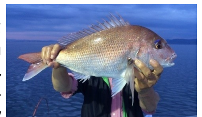
【フィッシング大会のNews】

各コースの魅力や現地の様子を紹介する特設サイトを越五の国HP内に新設しました。随時、情報を更新しますので、お目当てのコースを見つけて、合宿に参加しませんか。