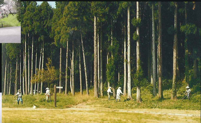
管理組合による定期的な 草刈りの様子