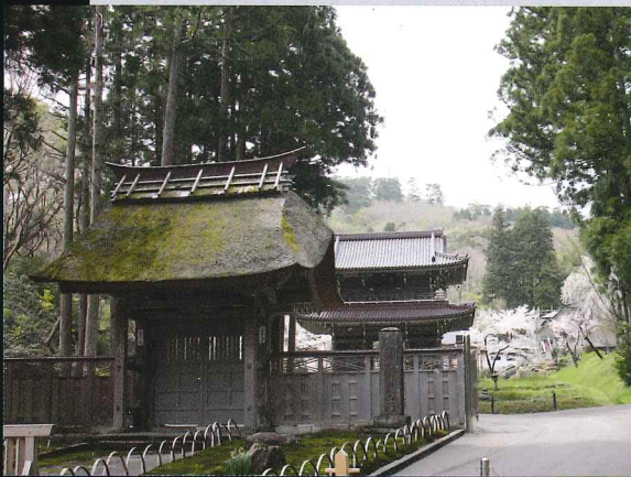
史跡指定地外にある 春日山城跡ゆかりの 林泉寺