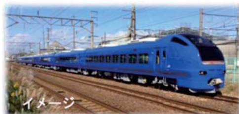
【東京駅までの到達時分比較】

○秋田発「いなほ 8 号」の時刻を変更し、停車駅の少ない「とき」に接続することで東京までの到達時分を大幅に短縮します。