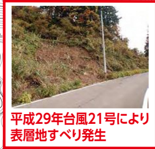
平成29年台風21号により 表層地すべり発生