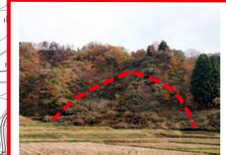
以前からゆるやかな 地すべり進行中