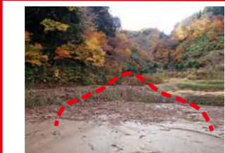
平成29年台風21号により 土石流発生