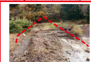
平成29年台風21号により 土石流発生