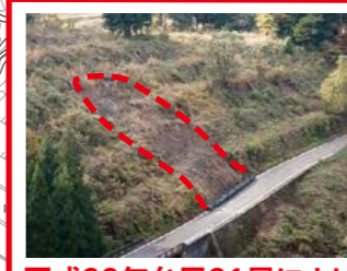
平成29年台風21号により 表層地すべり発生