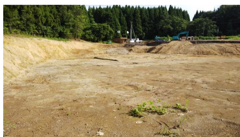
谷側から現場事務所方向を撮影 (平成30年8月20日)