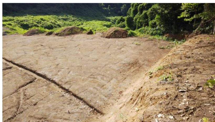
山側から谷側方向を撮影 (平成30年8月20日)