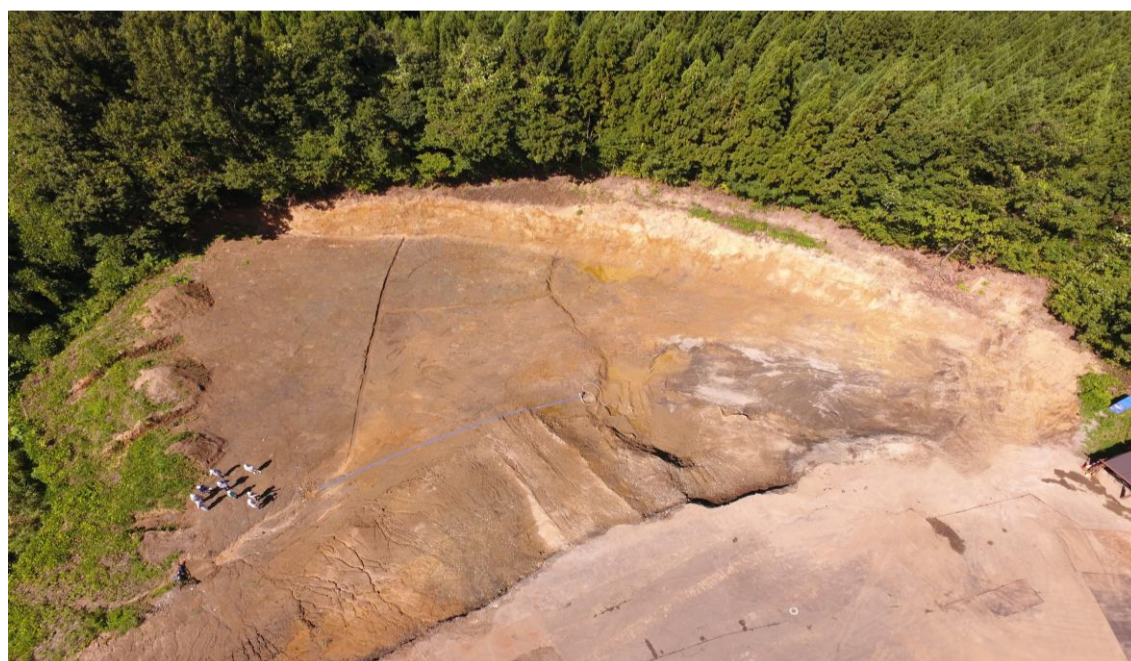
平成30年8月18日撮影の上空写真