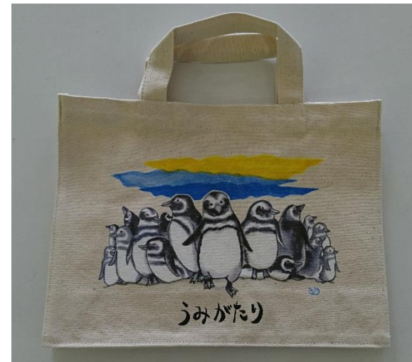
㈱ワクイ／マゼランペンギン・トートバッグ