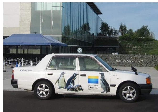
頸城ハイヤー／マゼランペンギンのラッピング