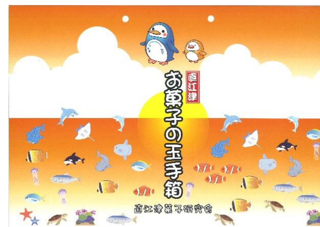
直江津菓子研究会／お菓子の玉手箱 キャラクターやイルカ等をデザインした包装紙