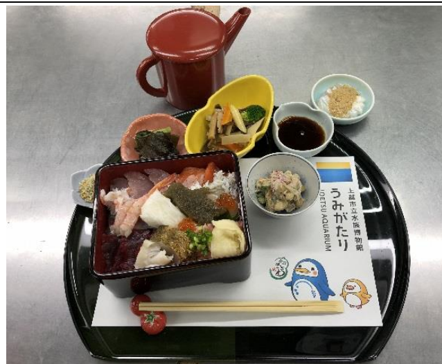
会心きざわ／うみがたり丼（海鮮丼）