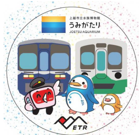
えちごトキめき鉄道(株)／キーホルダー 入館料 200 円引きクーポン付フリーパスの発行