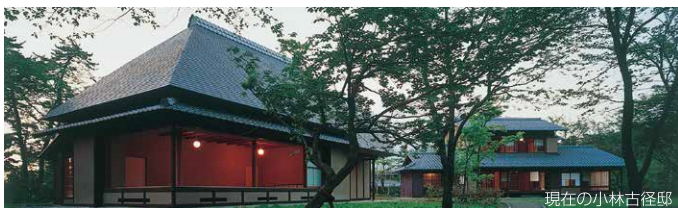
現在の小林古径邸

リニューアル後には、小林古径作品のほか、富岡惣一郎や牧野虎雄、齋藤三郎などをはじめとする上越ゆかりの絵画、陶芸、彫刻などの多彩な美術作品を展示するとともに、美術を気軽に体験できる場を設け、市民に親しまれる美術館を目指して再出発いたします。