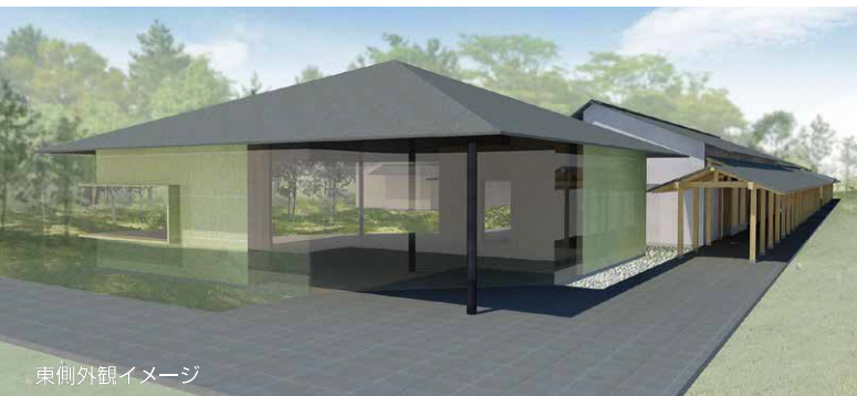
東側外観イメージ