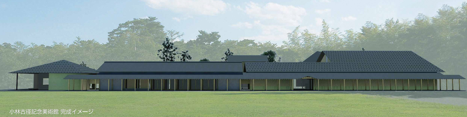
小林古径記念美術館 完成イメージ