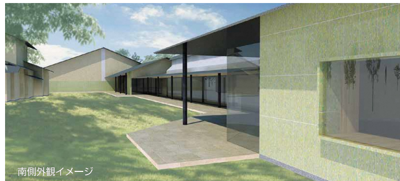
南側外観イメージ