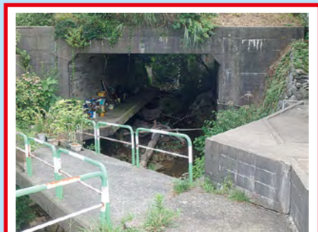
土砂等で詰まった場合に 川の水や土砂が溢れるおそれあり