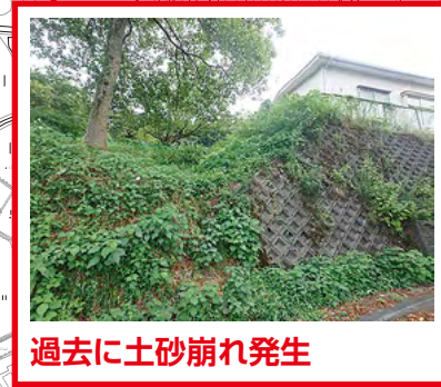
過去に土砂崩れ発生