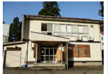
上方地区集落開発センター ※上方町内会が定めた一時集合場所 ※警戒区域内のため速やかに安塚小学校へ避難が必要