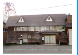
安塚地区集落開発センター ※安塚町内会が定めた一時集合場所