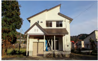
牧野地区集落開発センター ※牧野町内会が定めた一時集合場所 ※警戒区域内のため速やかに安塚小学校へ避難が必要