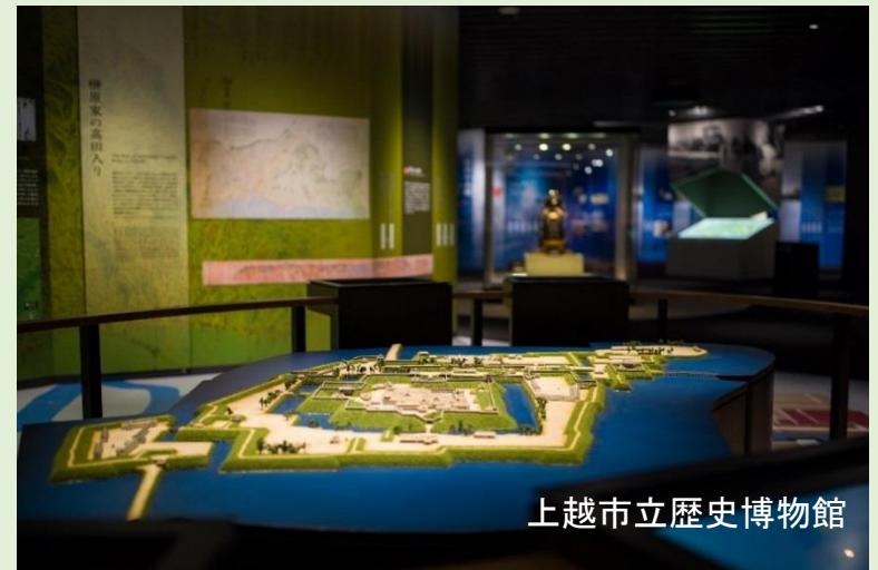
上越市立歴史博物館

2018年6月に上越市立水族博物館「うみがたり」がグランドオープンしました。 また、同年7月に上越市立歴史博物館がリニューアルオープンし、 市内に新たな魅力が増えました。