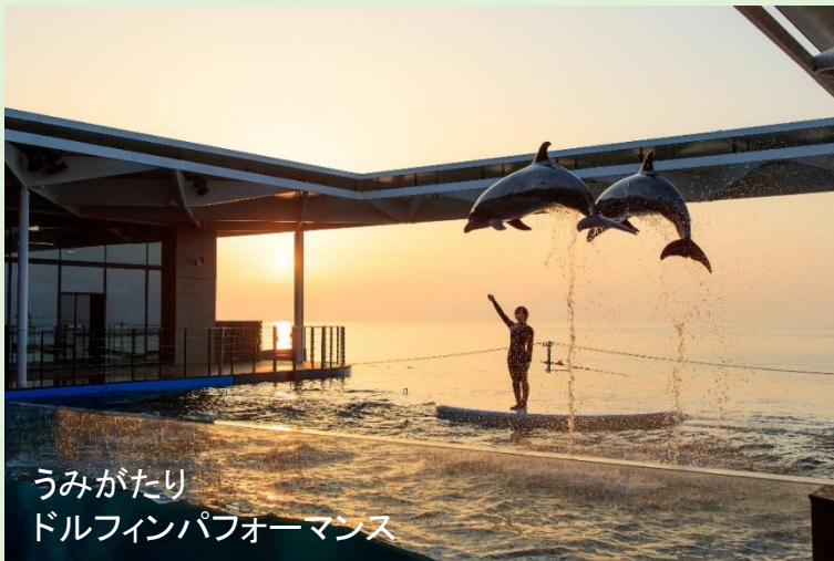
うみがたり ドルフィンパフォーマンス