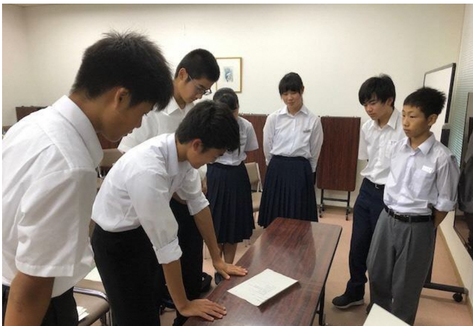
報告場所を話し合いで決める