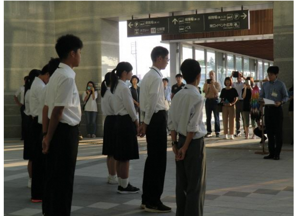
大勢の方々が見送りに来てくれました