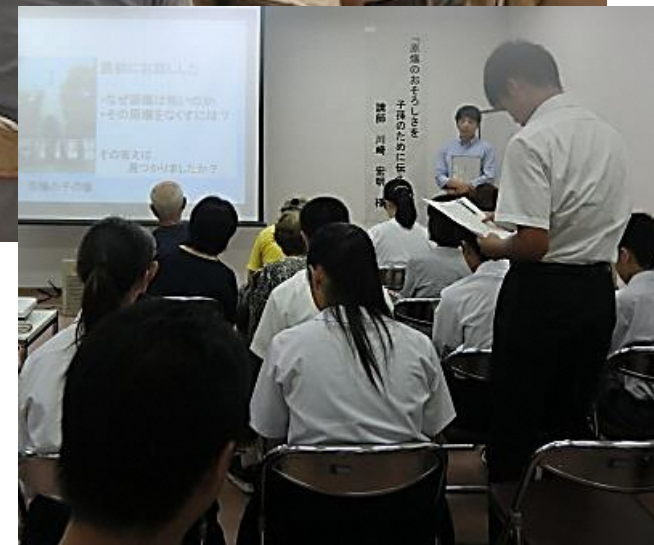
講話会の感想を発表