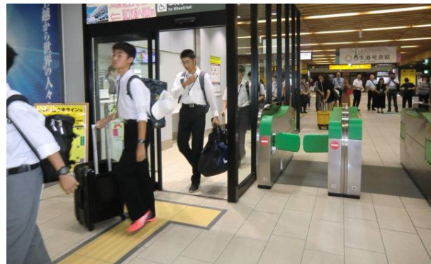
いよいよ出発です