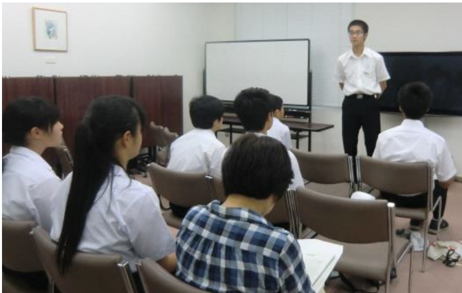
自己紹介で参加への思いを発表