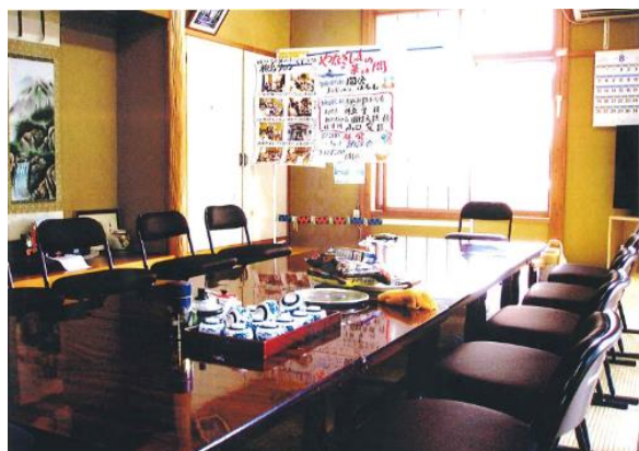
↑ 柳島サロン研修会等支援事業