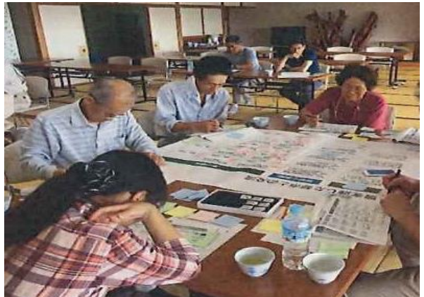
↑ 原地区集落ネットワーク圏活性化プラン策定事業