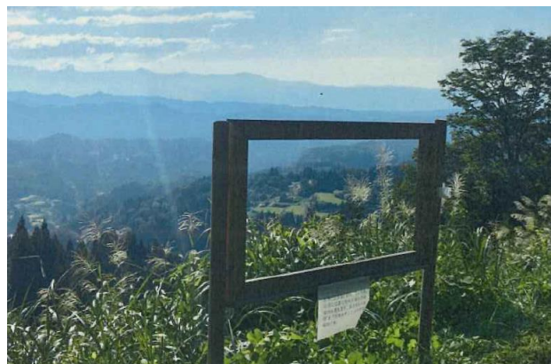
↑ 棚広新田魅力発見事業