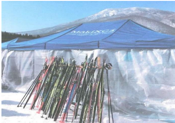
↑ クロスカントリースキートレーニング及び 大会環境増強事業