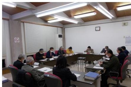
地域協議会の会議の様子

また、会議で話し合った内容は、意見書として市長に提出し、その実現を求めることができます。