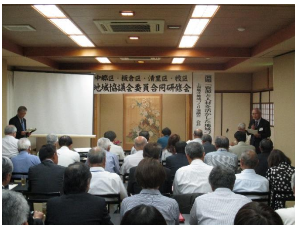
【4 区（中郷区、板倉区、清里区、牧区）地域協議会委員合同研修会の様子】