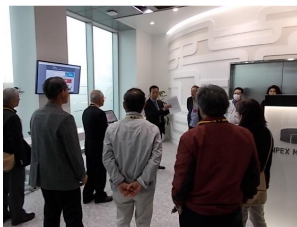
【視察修会の様子（平成30年度(左)：令和元年度(右)】