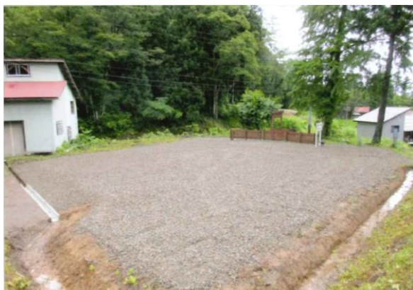
↑ 地域交流、歴史、番所を活かした教育広場事業