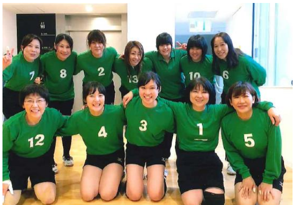
↑牧愛好会活動活性化事業