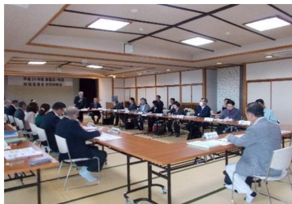
【2 区（牧区、清里区）地域協議会委員合同研修会の様子】