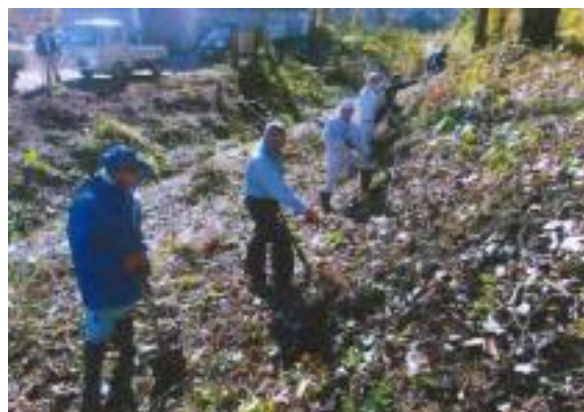
↑ 沖見地区観光拠点作り事業