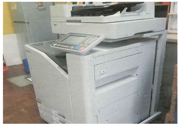
↑ 地域情報発信支援事業