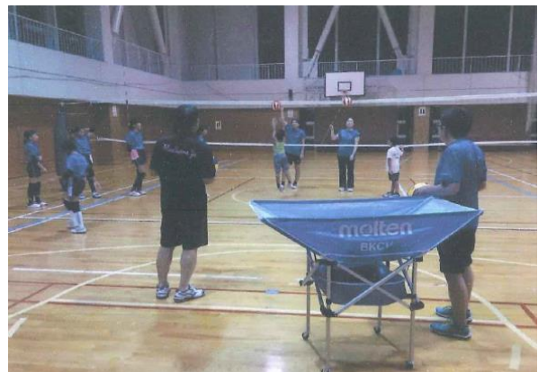
↑牧フレッシュガールズ夢☆感動事業