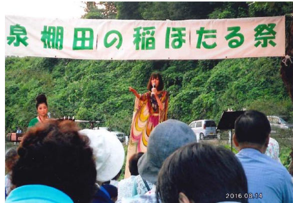
↑泉 棚田の稲ほたる祭事業