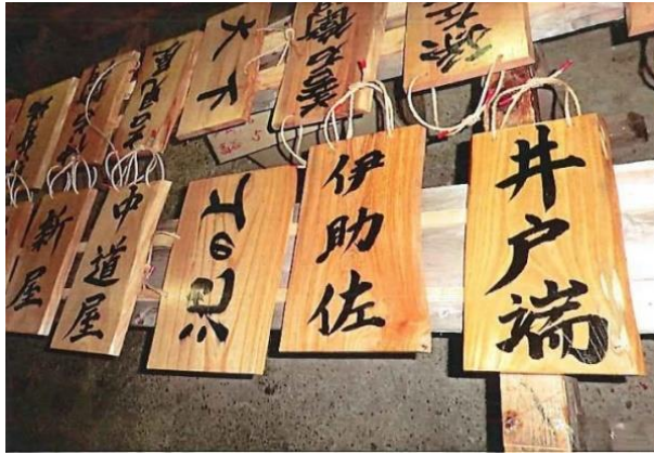
↑ 屋号を活かし、地域を活性化させる事業