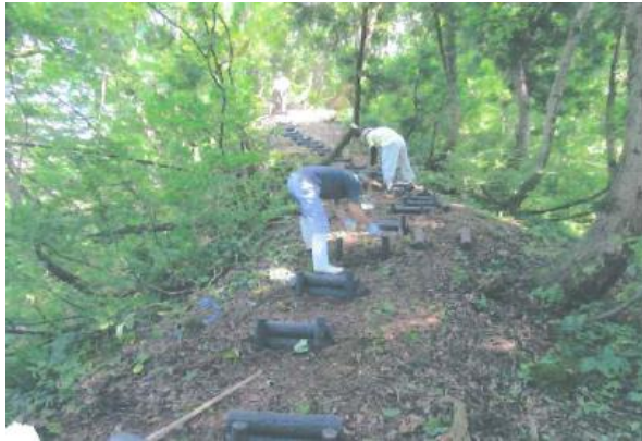
↑岩神城趾 遊歩道整備事業