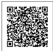
ホームページはこちら！