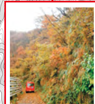
崩壊のおそれあり