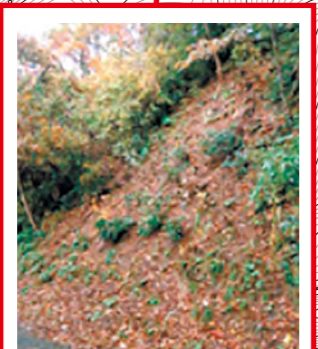
崩壊のおそれあり