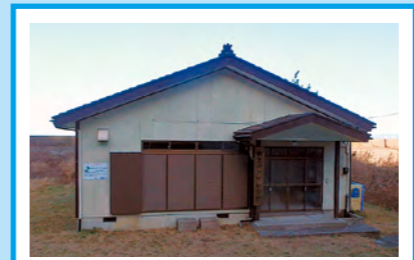
虫生岩戸町内会館 ※警戒区域内のため速やかに国府 小学校へ避難が必要