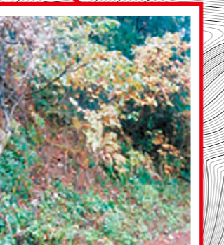
崩壊のおそれあり