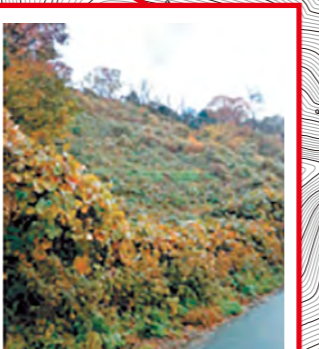
崩壊のおそれあり