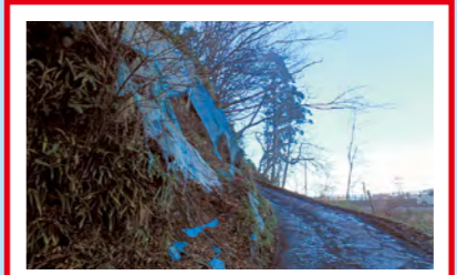
崩壊のおそれあり