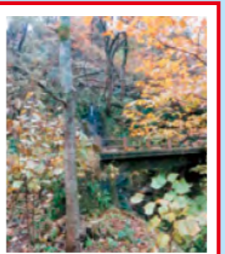
御滝橋 土石流のおそれあり