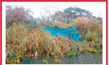
過去に数度土砂崩れ発生 今後も土砂崩れのおそれあり