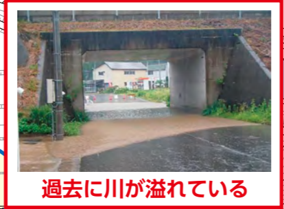
過去に川が溢れている