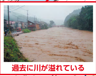
過去に川が溢れている