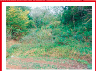
過去に地すべり発生