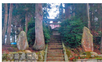
甲埜神社 ※警戒区域内のため ①「旧名南グラウンド」 ②「宝田小学校」 の順で速やかに避難が必要