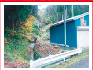
過去に土石流発生