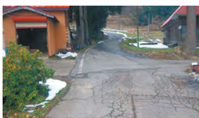
桂谷避難場所 ※警戒区域内のため ①「旧名南グラウンド」 ②「宝田小学校」 の順で速やかに避難が必要