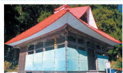
善興寺観音堂 ※警戒区域内のため ①「旧名南グラウンド」 ②「宝田小学校」 の順で速やかに避難が必要