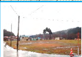
旧名南グラウンド ※警戒区域内のため速やかに「宝田小学校」へ避難が必要