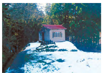
峠集会所 ※警戒区域内のため速やかに「宝田小学校」へ避難が必要