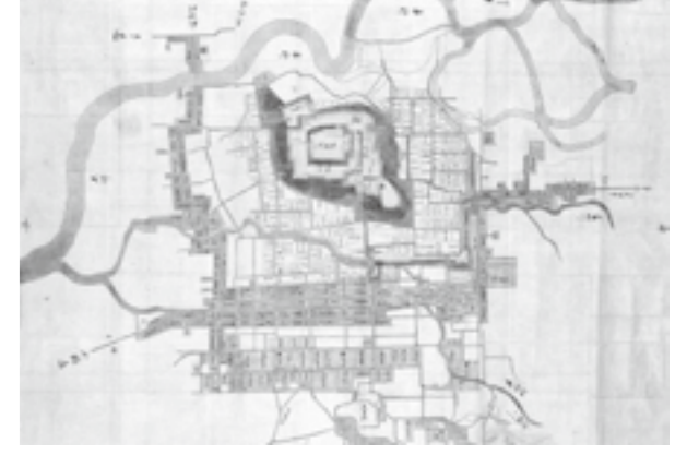
江戸時代中期の高田城下町