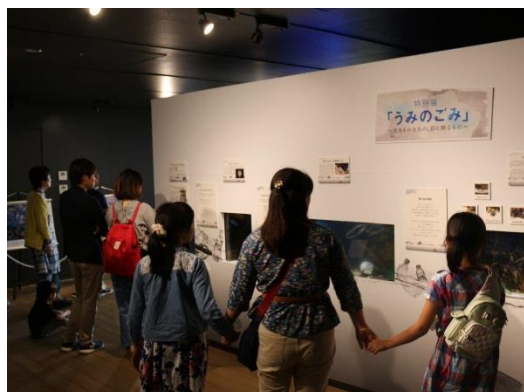
特別展「うみのごみ」観覧状況