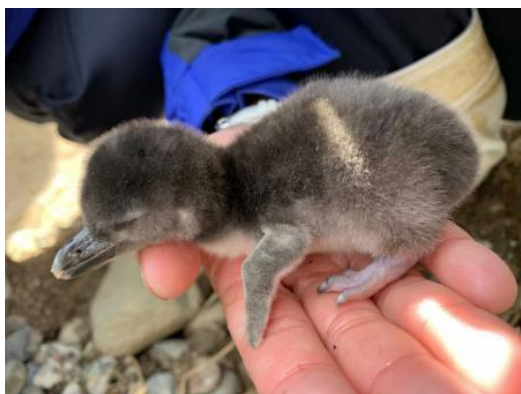
マゼランペンギンの雛