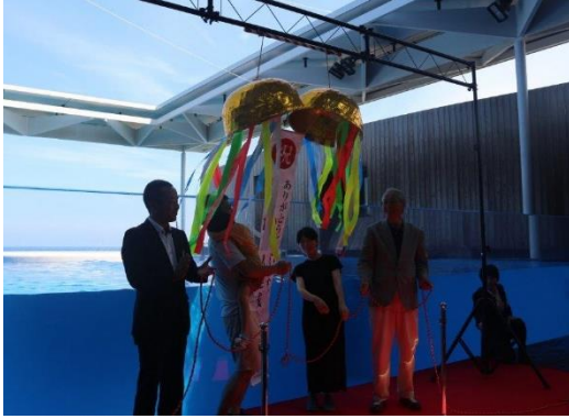
入館者 100 万人達成記念セレモニー