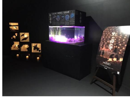
灯の回廊との連携展示