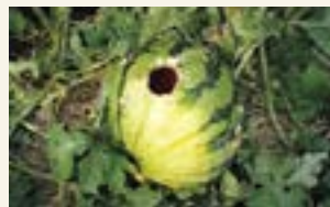
スイカに穴をあけ、中身を食べる

野生化したアライグマは全国で生息情報があり、市内でも広範囲で痕跡が確認され、ほぼ全域で生息している可能性があります。果実や野菜類、小型哺乳類など何でも捕食し、木造の家屋や神社等にすみ着きます。また、繁殖力が非常に高いため、甚大な被害につながります。