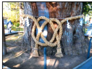
しめ縄を結んだ大スギ

集落の皆様から協力をいただき、周辺の掃除や樹勢回復作業などを行い、次世代へとつなげていきたいと考えております。