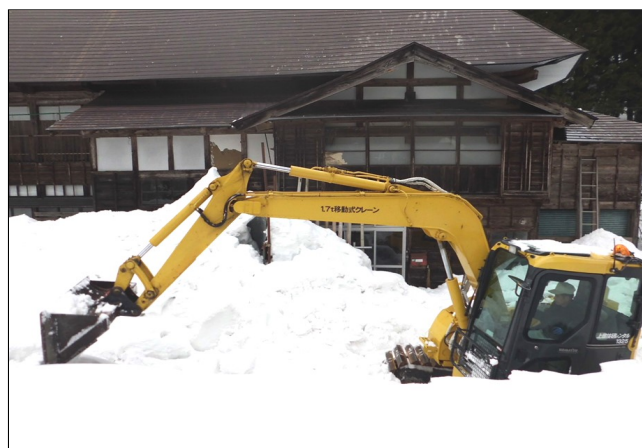
要援護世帯の除排雪を実施する重機貸出 (1月18日、上猪子田町内会)

今後も寒気が入り、降雪が多いと想定されます。除雪作業中の事故も増加傾向にありますので、次ページの注意事項を参考にし除雪作業にあってください。