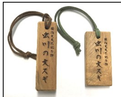
大スギを加工したストラップ

◆問合せ先…教育・文化グループ ☎599-2104 ※3月号は「山田あき歌碑・聖徳太子像」を紹介する予定です。