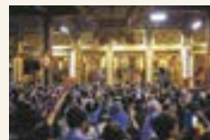
勝興寺で行われた「ふるこはんフェス」の様子