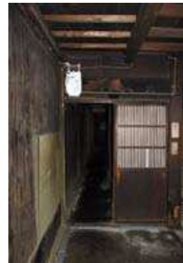
ミセ土間からトオリニワへの入口。