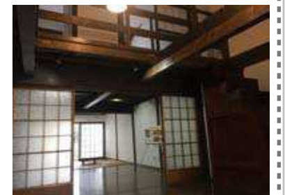
建具や箱階段を再利用している例

まずは、「何のために」改修したいのか、その目的を明確にしましょう。その上で、設計者や施工業者に相談し、見積もりを作ってもらいます。要望の中での優先順位はどうか、また現在のもので再利用できるものはないか、等で、金額の調整をはかっていきましょう。