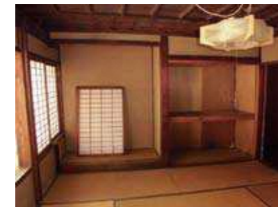
オモテニカイの様子