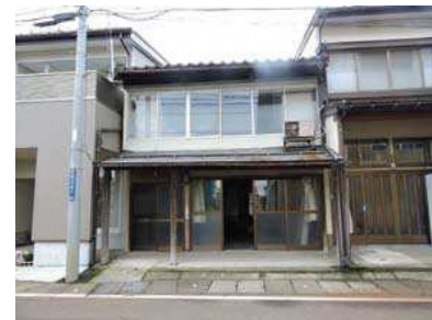
改修前の正面の様子

このガイドブックで紹介する改修例のもとになる町家の例です。 間口3間 奥行12.5間 総面積約56坪の少し大きめの町家です。 主屋は大正時代につくられ、その後何度か増築・改築をしています。 2階ナカノマは、もともと吹抜けだったところに床を張って部屋として利用していました。 水回りはトオリニワを通った奥の方に配置されていますが、キッチン は中庭に面して増築された1階に設置されています。