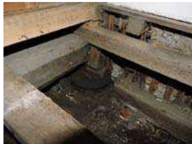
1階床下の様子。だいぶ傷んでいます。