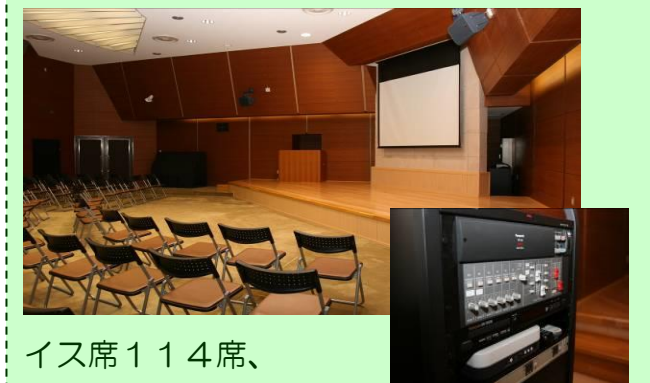
イス席114席、 プロジェクター、音響、ピアノ、演台 ※利用には申込が必要です。

プロジェクター、音響設備が完備されています。ミニコンサート、映写会、講演会など各種イベントの会場としてご利用ください。