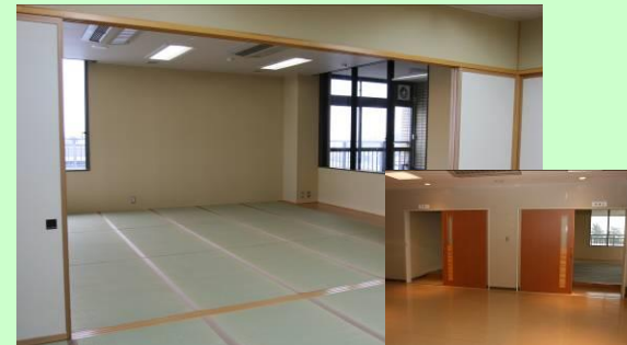
和室1：18畳 和室2：12畳 テーブル7台、座布団40枚、テレビ ※利用には申込が必要です。

30畳の和室です。2つに区切って使うことができます。華道、茶道、着付けなどのサークル活動の場としてご利用ください。