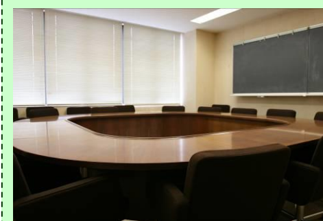
301会議室：15席 302会議室：12席 ※利用には申込が必要です。

大きさの異なる会議室を2部屋整備しました。会議や研修、講習会などに広くご利用ください。