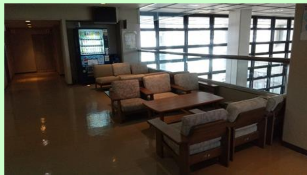
ソファ席12席、自動販売機、テレビ

地域の情報発信機能を持った休憩場所です。図書室での学習の合間や会議などの待ち合い時にご利用ください。