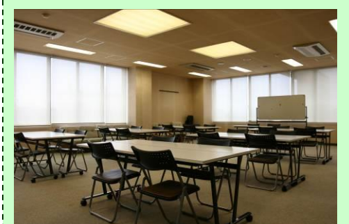
机13台、イス26脚、 ホワイトボード ※利用には申込が必要です。