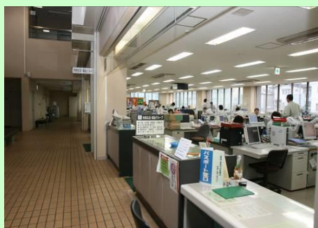
市民生活・福祉グループ、教育・文化グループ、総務・地域振興グループ、産業グループ、建設グループ