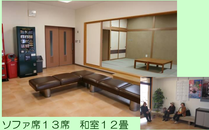
ソファ席13席 和室12畳 自動販売機、テレビ、囲碁将棋盤

誰もがつどえる憩いの場として整備しました。バスの待合いや仲間との待ち合わせなど気軽にご利用ください。