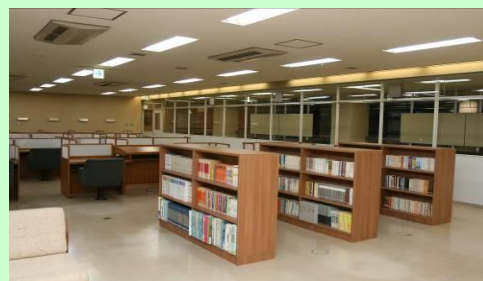
蔵書約3,500冊、 閲覧学習席27席

蔵書約3,500冊を所蔵する図書館です。広い閲覧スペースを整備しましたので、図書の閲覧のほか、学習の場としてもご利用ください。