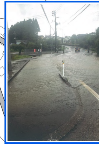
大雨時、道路に水が溜まる